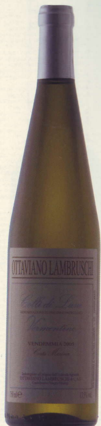
Colli di Luni Vernentino Costa Marina 2005 Ottaviano Lambruschi

強い日差しをはね返す、硬い粘土質と砂質の白色土壌。そして雨雲を遮るアルプスとアペニン山のふたつの山脈。こうした環境下が好都合なのか、果皮が薄い、繊細なロッセーゼが栽培できるのはここだけだ。濃い桜色、野イチゴ、フサスグリなどの小粒の赤果実と花系のアロマ、軽やかな酸味。乙女チックな小悪魔っぽい魅力がある。