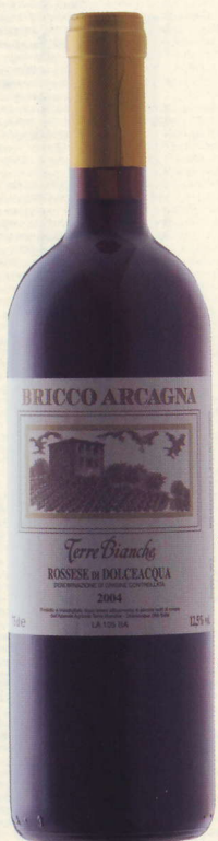
Rossese di Dolceacqua Bricco Arcagna 2004 Terre Bianche