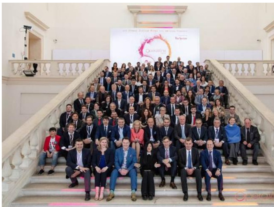
L'edizione 2019 di OperaWine